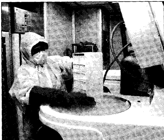
Qui sopra, il microdisettore Carl Zeiss. A destra e sopra due immagini della cell factory dell'Ismett di Palermo