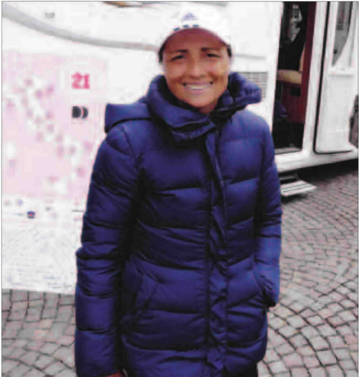
La maratoneta mostra le tappe del suo personale Giro d'Italia, arrivato quasi al termine