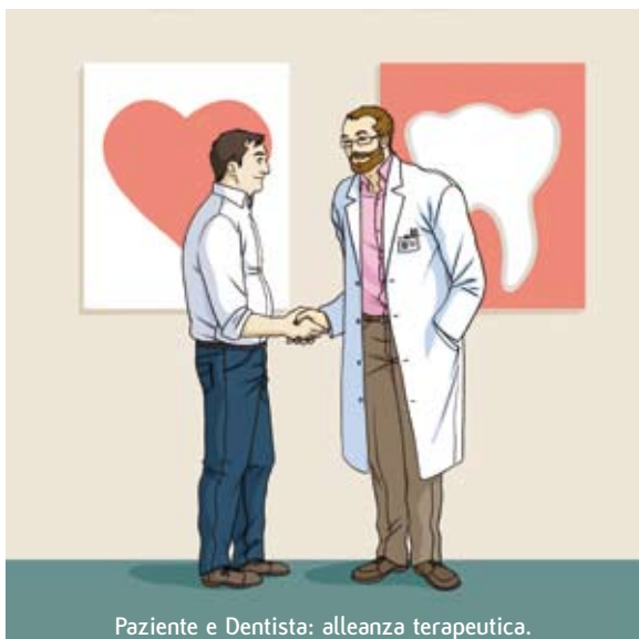
Paziente e Dentista: alleanza terapeutica.

Sappiamo che le gengive, specie se infiammate, costituiscono una porta d'ingresso virtuale per i batteri della